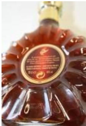
Remy Martin XO