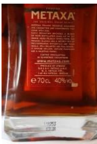
Metaxa Private Reserve

Umístění: LOT je natištěn na zadní straně lahve