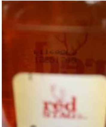
Jim Beam Red Stag