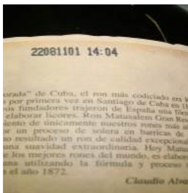
Matusalem Gr. Reserva

Umístění: LOT kód je natištěn na zadní straně etikety.