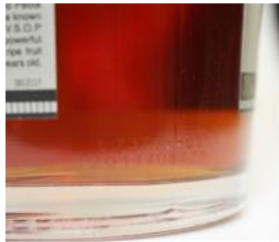
Remy Martin VS a VSOP

Umístění: LOT je na zadní straně vyleptán do skla Důležitých je prvních 5 znaků včetně písmene L !