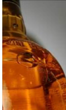
Jim Beam Honey

Umístění: LOT kód je vyleptán na zadní straně lahve (někdy nad etiketou vzadu). Důležitých je prvních 5 znaků včetně písmene L !