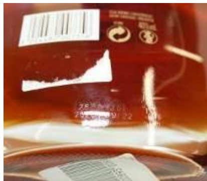
Remy Martin Coeur De Cognac