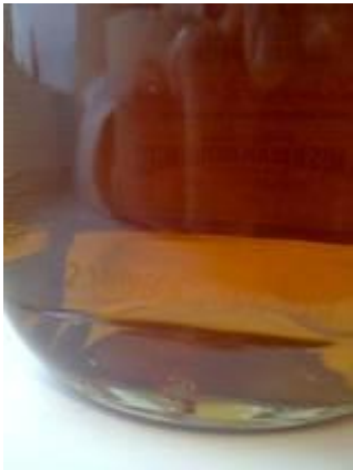
Jim Beam White